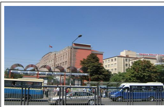
Sıhhiye 橋，亦可在此搭 dolmuş 回學校

往 Sıhhiye 方向的車為 SM =Sıhhiye-Merkez，會在 Sıhhiye köprüsü 下車，步行即可到達 kızılây 。