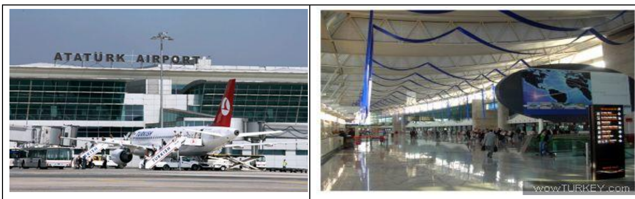
İstanbul – Atatürk Havalimanı