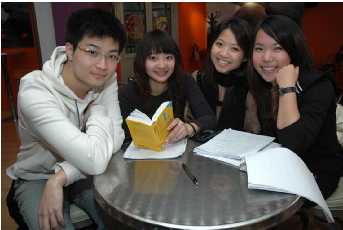
(做作的在咖啡廳唸書)